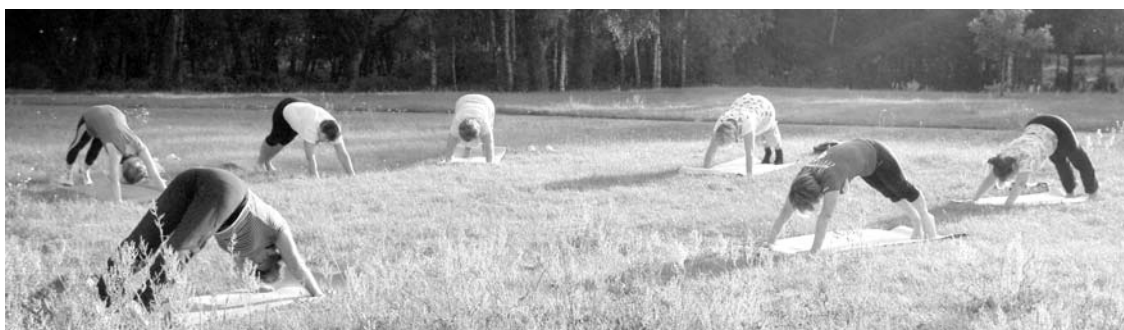
Jau penktus metus anykštėnai kviečiami mankštintis drauge gamtoje.