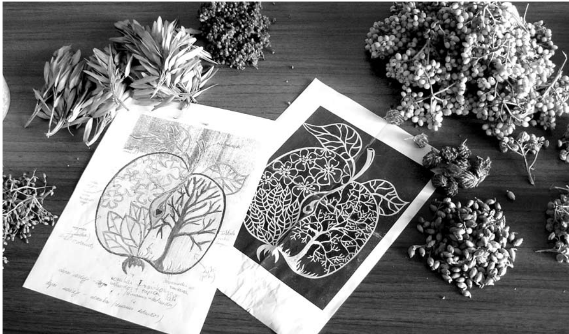
Kilimo vaizdinį išdidina ir ant medžiagos perpiešia klotėjų bičiulė iš Anykščių, dirbanti statybose dažytoja.