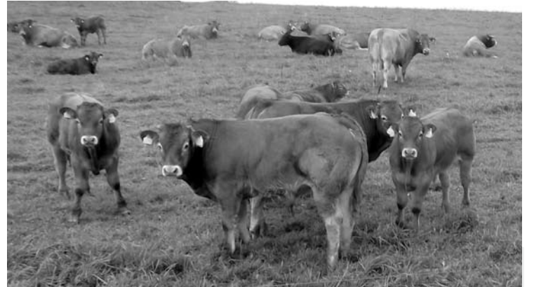
Karių limuzinų veislės galvijų mėsa keliauja ir ant išrankių šveicarų stalo.

Ūkininkas aiškino, kad limuzinai nėra reiklūs laikymo sąlygomis. „Mes jų nelepiname. Vasarą ganome ganykloje ir papildomai duodame laizomų druskų su mineralinėmis medžiagomis. Taip laikomi galvijai per parą priauga apie 1 kg svorio.