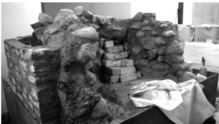
Kol atliekami restauracijos darbai, krosnies pakurų angą prilauko plytos.

Viešosios Anykščių bibliotekos rūsyje pluša restauratoriai atkurdami archeologinių kasinėjimų metu rastą XVI amžiaus krosnį. Archeologijos mokslų daktaro Gintauto Zabielos teigimu, ši krosnis senesnė už Vilniuje, Maskvos namuose, esančią krosnį. Tai – didelė vertybė, kurios restauracija kainuos 40 000 litų.