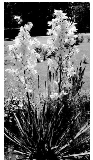
... sodyboje pražydo juka.