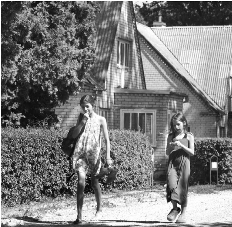
Vėjeliškių kaimo panelės eina maudytis.