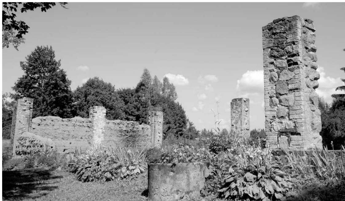
Buvusio Vėjeliškių dvarelio likučiai.